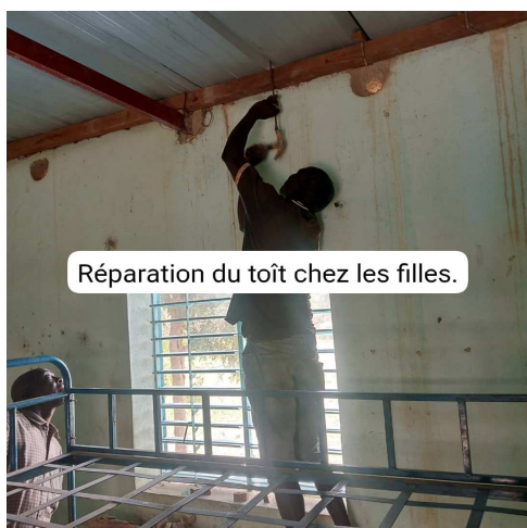
Réparation du toit chez les filles.