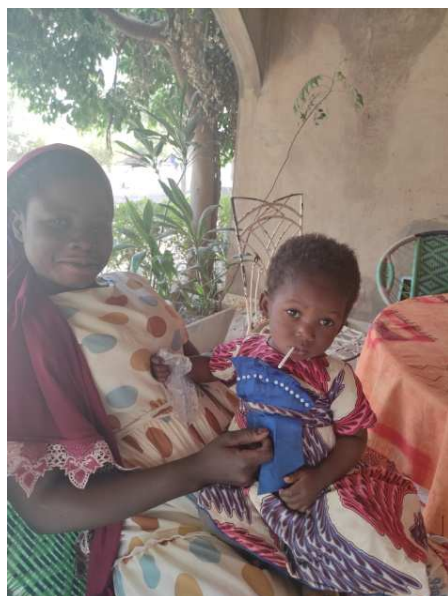
Faoshia et sa fille